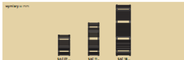
wymiary w mm

L = szerokość H = wysokość Lp = poziom przelotów zawieszki Hs = pionowy zestaw zawieszki Hp = rozstaw przyłączy