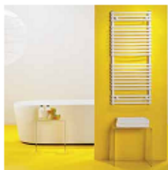
widok z przodu